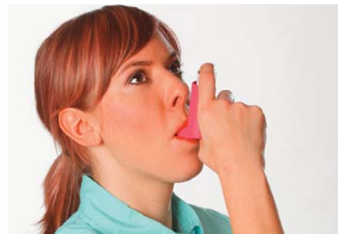
Quellen: Foto Kirchheim-Verlag; Zeichnungen ÄZQ